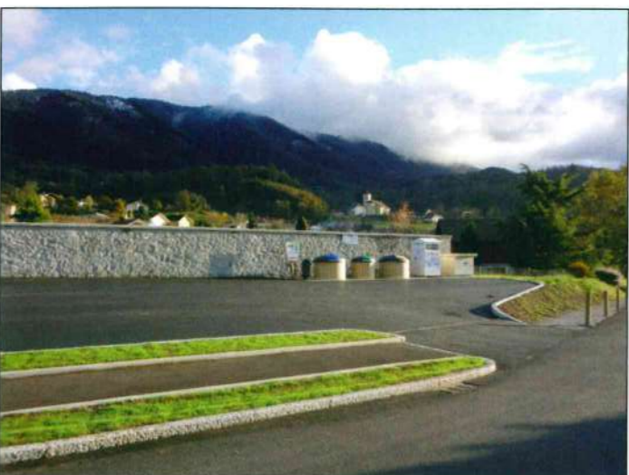
Abords du cimetière