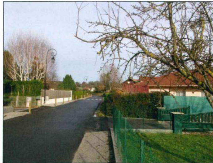
Route des Bois