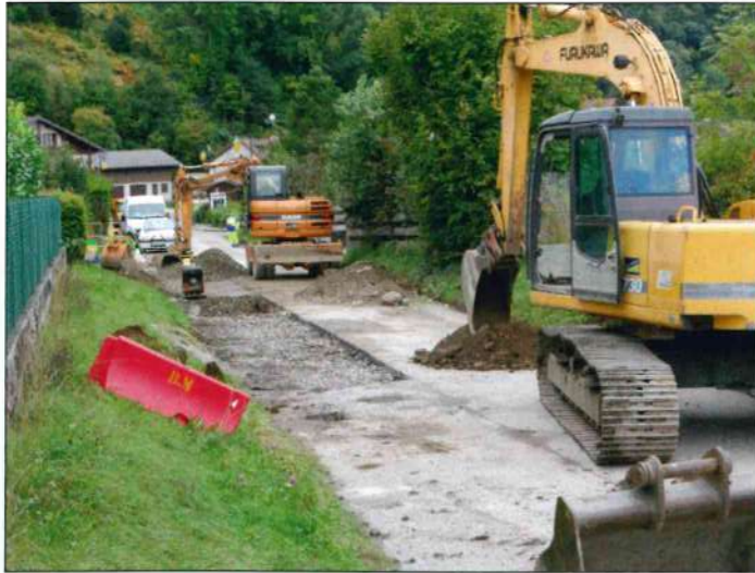
Rue du Sommetant