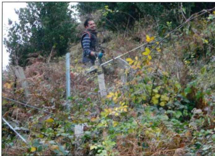
Débroussaillage du Cez par le LIEN