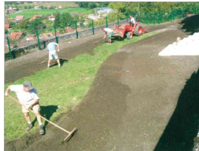
Pelouse de la micro-crèche.