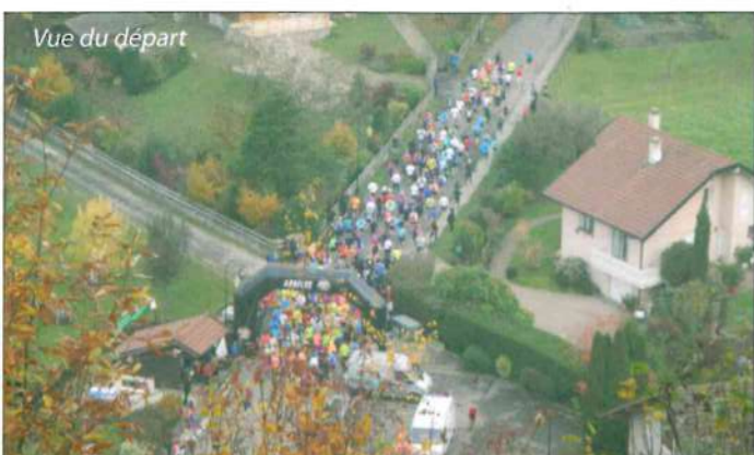
Vue du départ