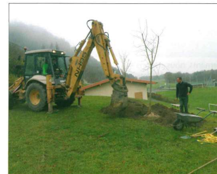
Plantation d'arbres au stade.