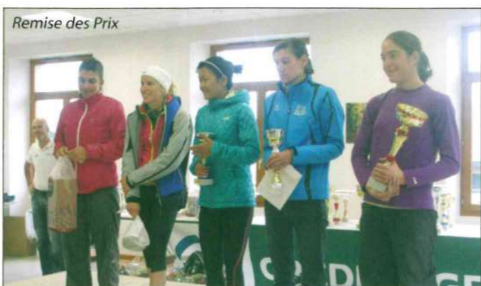
Remise des Prix