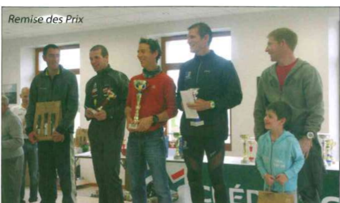
Remise des Prix