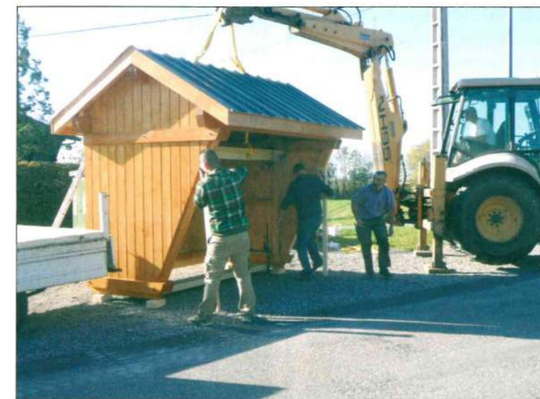
Mise en place d'un abri-bus, route des Cruets.