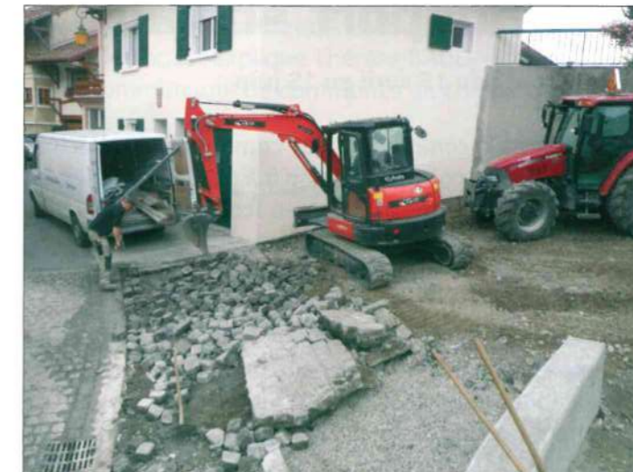
Pavage de l'entrée de la place de l'église.