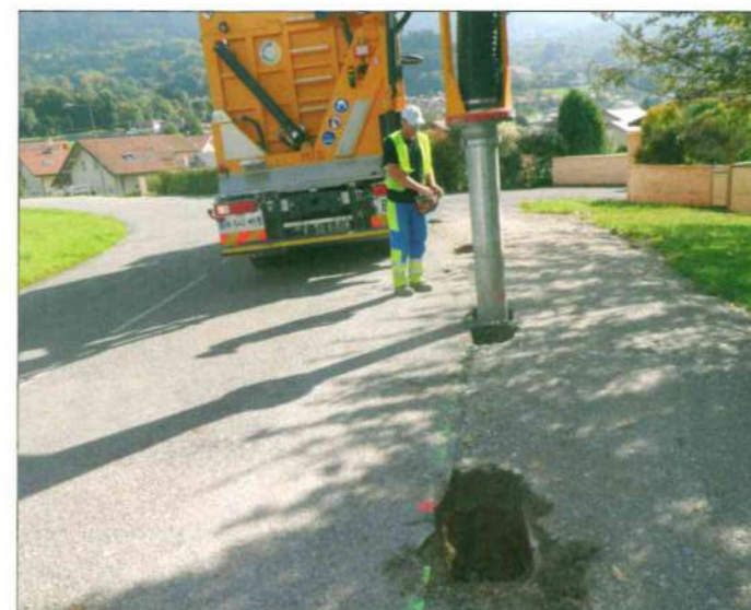
Réalisation du chemin piétonnier, route des Cruets.