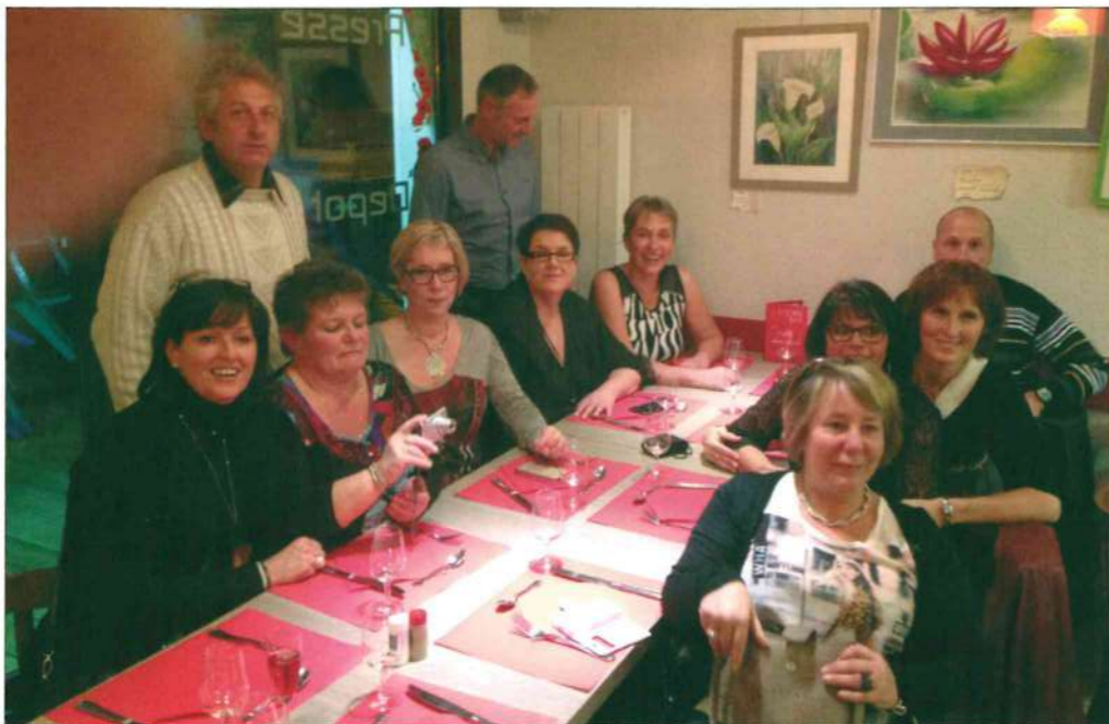
Ils sont nés en 1964 et se sont retrouvés au DJOSS BAR, pour fêter leur 50 e anniversaire