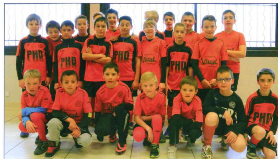
La relève est assurée !