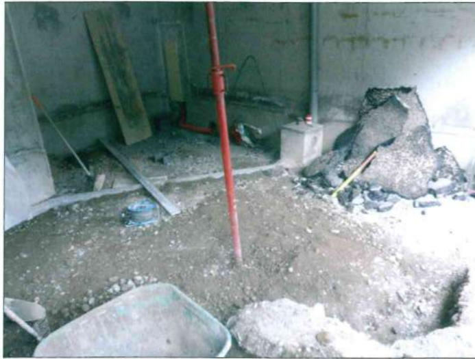
Agrandissement du D'joss Bar