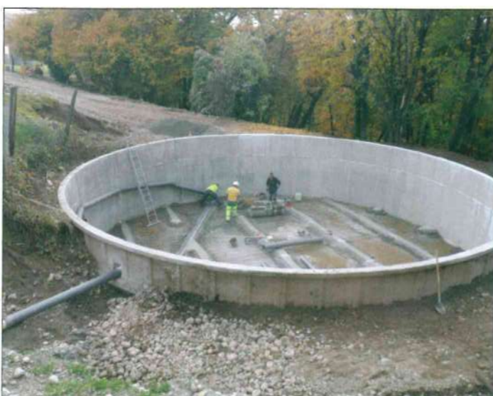
Travaux dans la fosse pour la réception des eaux pluviales