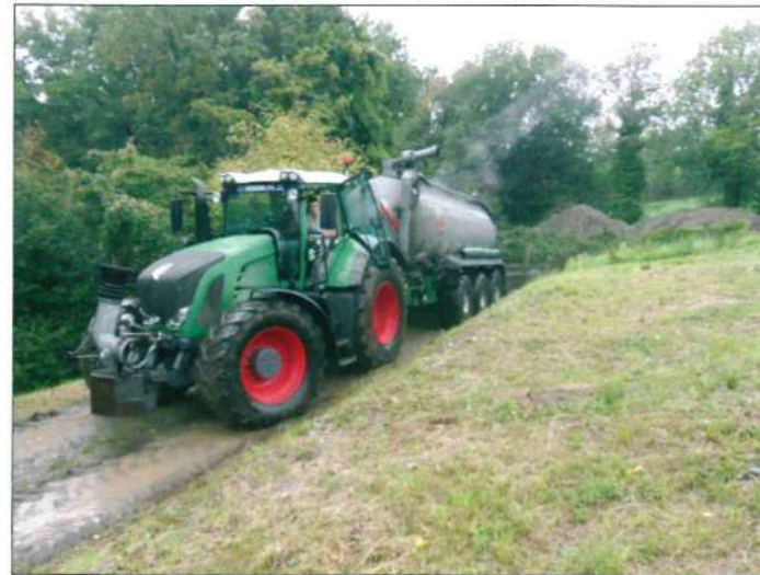
Vidange de l'ex-fosse à lisier