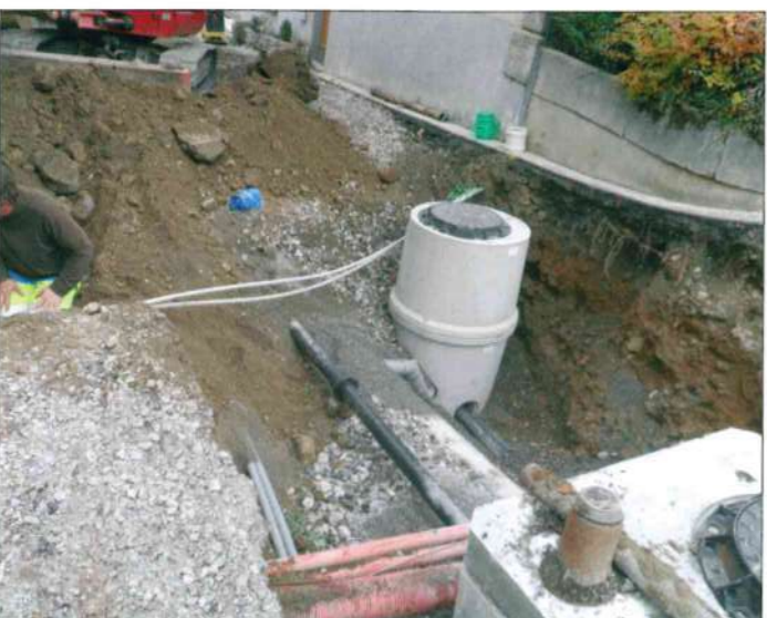
Enfouissement des réseaux route de la Glière