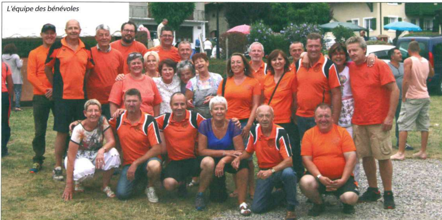
L'équipe des bénévoles

Cette manifestation devenue incontournable, est organisée par l'Association Sportive Le Lyaud-Armoy Football, en partenariat avec l'Association Saint-Nicolas et la Commune, qui participe en fournissant le personnel technique pour l'installation des chapiteaux et en finançant le traditionnel feu d'artifice.