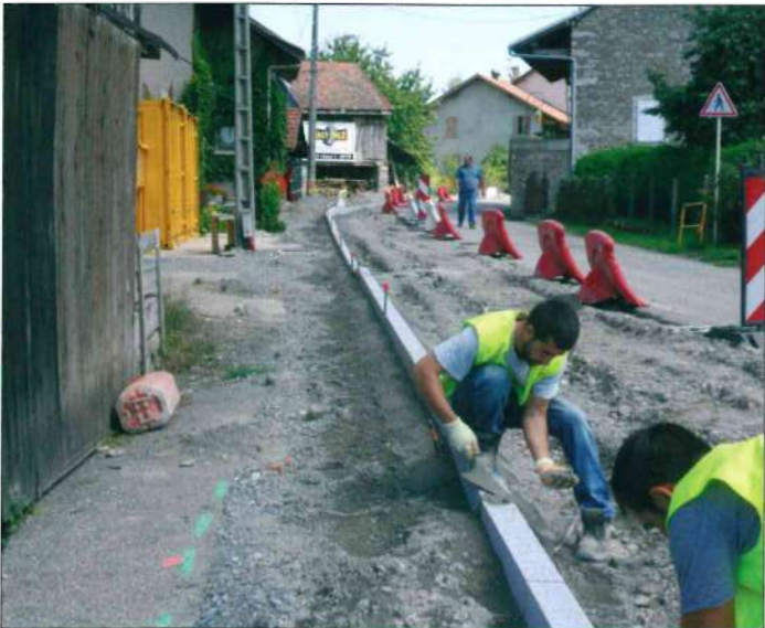
Travaux route d'Orcier