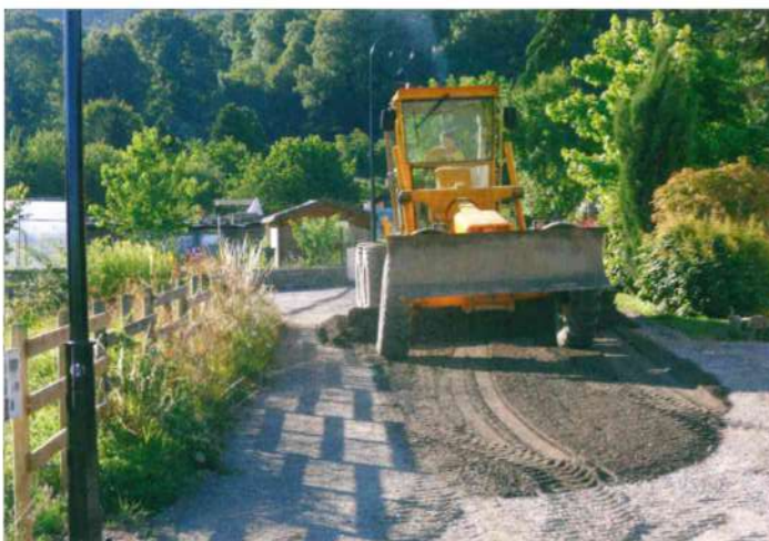
Rénovation totale de la route des Derrys