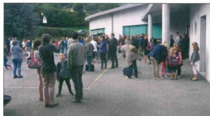
C'est aussi la rentrée pour les parents...