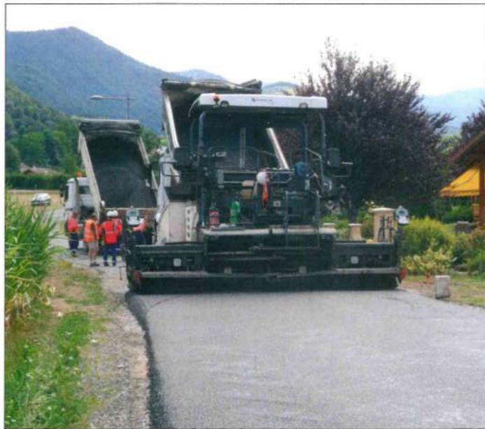
Goudronnage de la route des Rierets