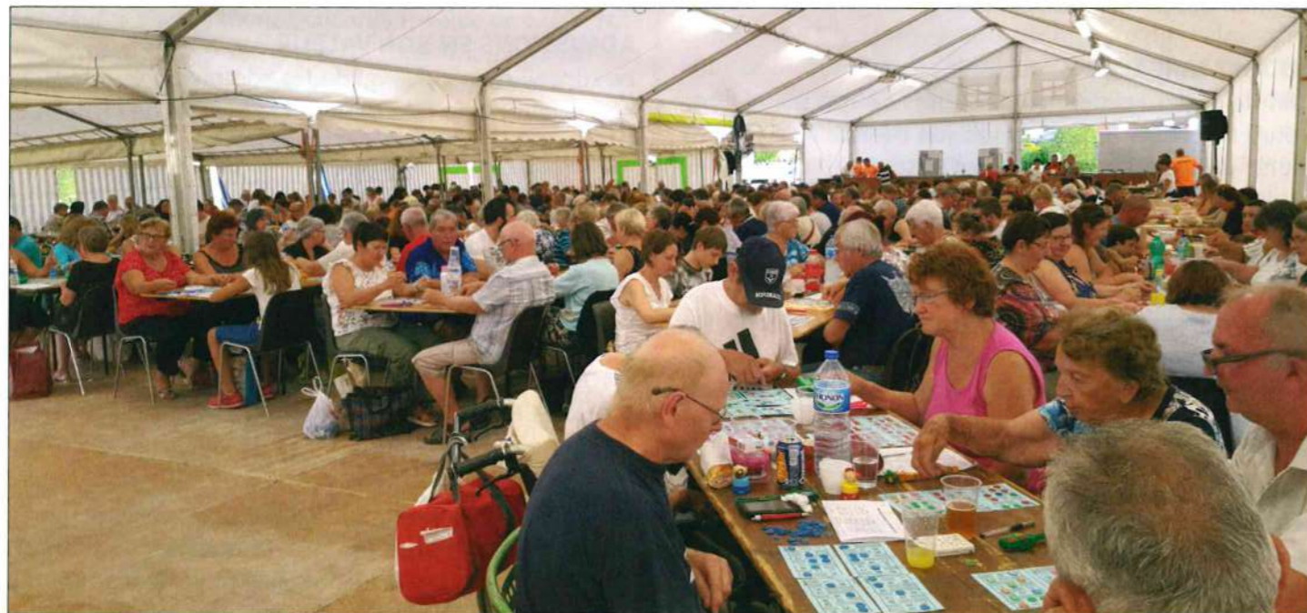
Il y avait foule au loto le samedi soir

Un grand merci à la municipalité qui fournit le personnel technique pour l'installation des chapiteaux et qui finance le traditionnel feu d'artifice.