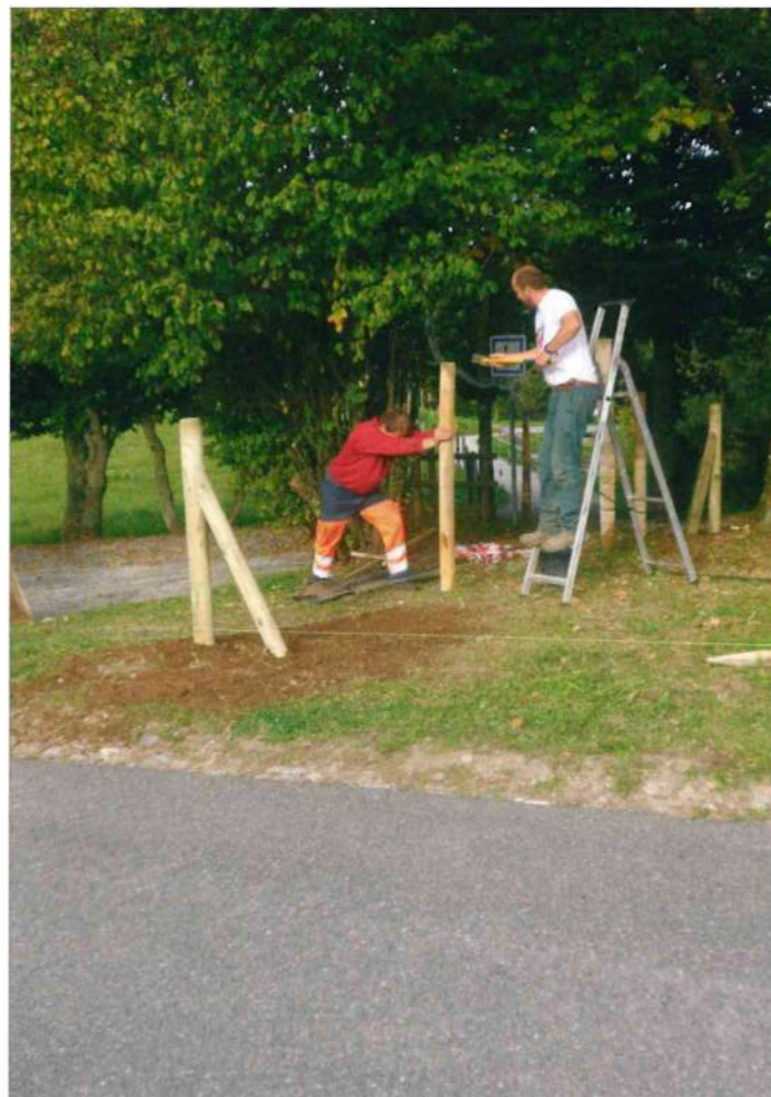
Installation de la clôture du Voua Bénit