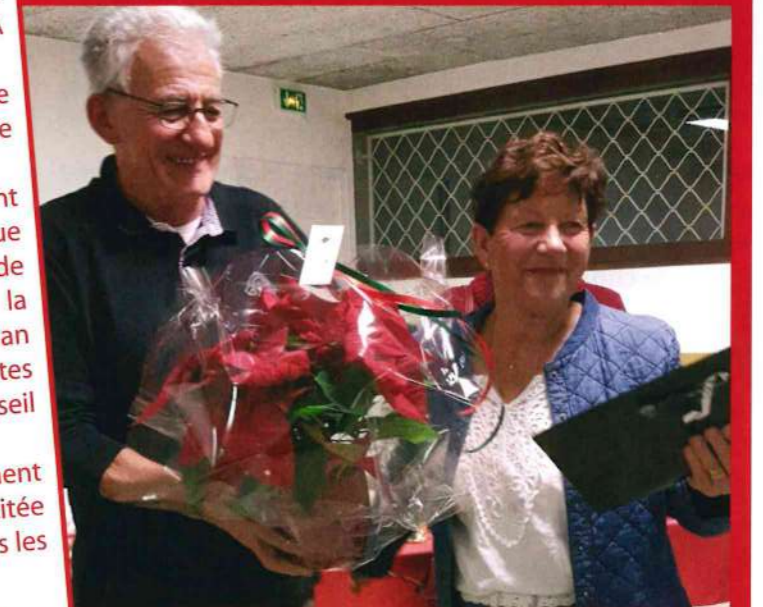
Passation de pouvoir

Association des donneurs de sang Armoy-Le Lyaud