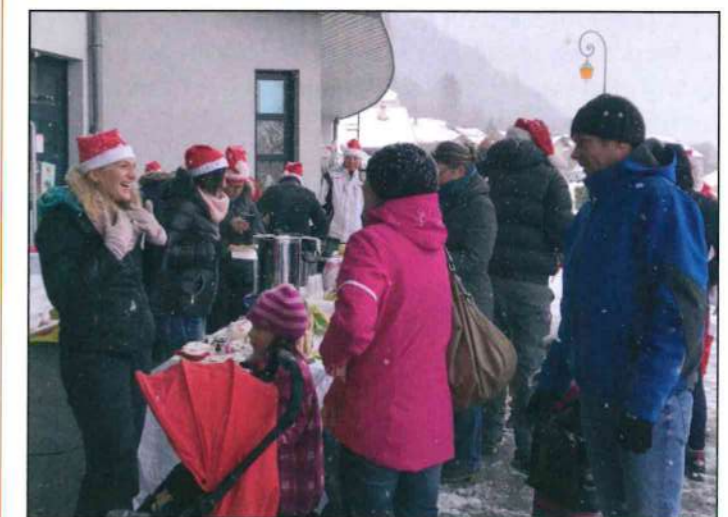
Les Parents d'Elèves très motivés !