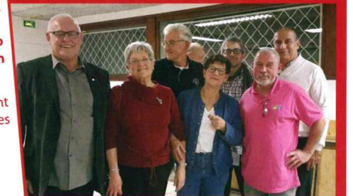
Avec les représentants de la Région et du Département