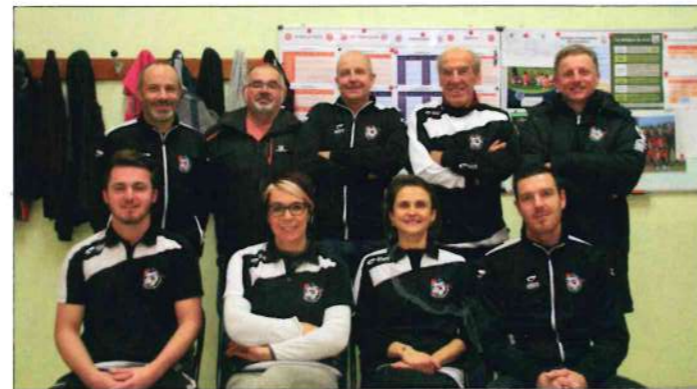
Le comité ALP.es