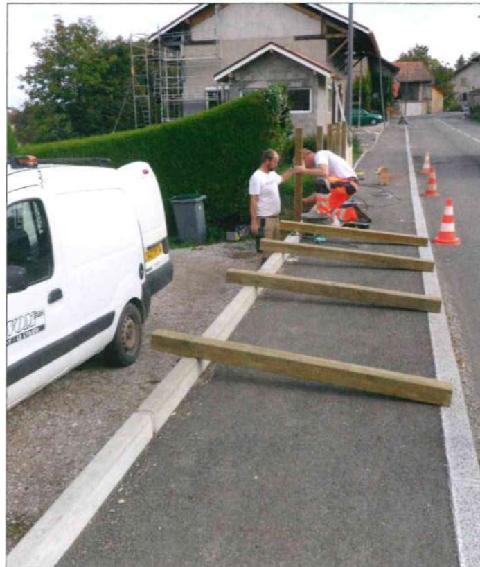
Sécurisation du trottoir de la route d'Orcier