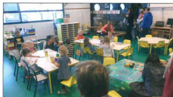
Les enfants de maternelle ont vite pris leurs marques dans les classes