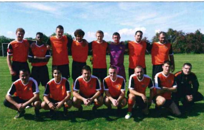
Les Seniors - Equipe 1

Nous vous donnons rendez-vous au printemps sur les stades, au tournoi des jeunes à la Pentecôte (25 e édition) mais aussi au loto, au vide-greniers et à la fête de l'été le dernier week-end de juillet.