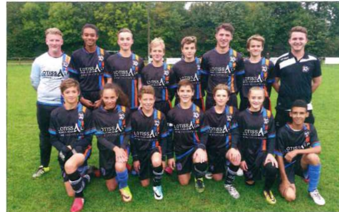
Les U15 - Equipe 1