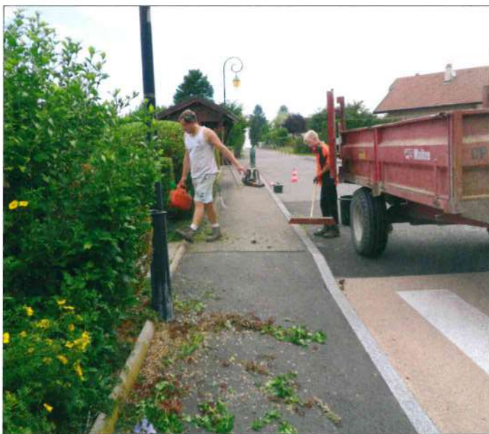
Taille au Champ Dunant