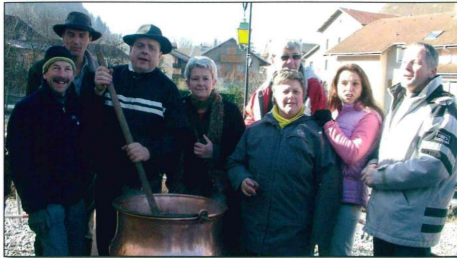
L'équipe "Sport et Loisirs" à la tâche.