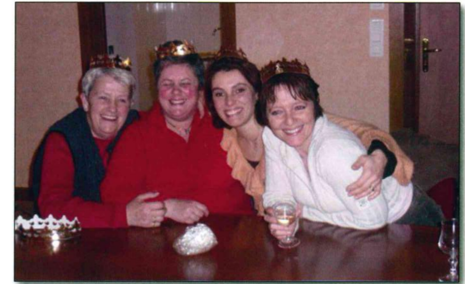
Les 4 femmes du conseil, élues reines d'un soir.