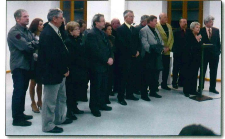
Les élus de la Communauté de Communes pour les derniers vœux.