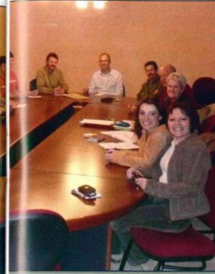
ambiance jusqu'au bout !