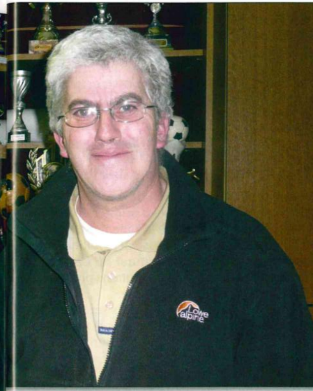
Le Président et le responsable des jeunes