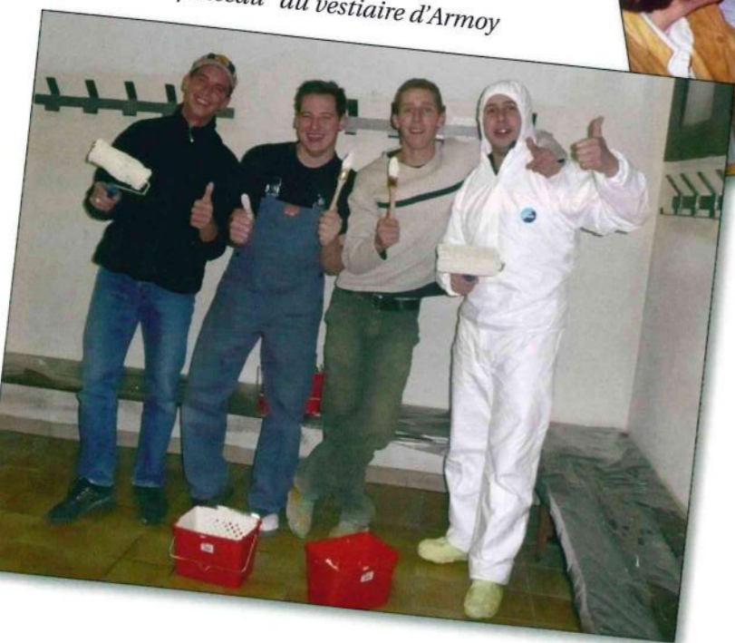
Les "rois du pinceau" du vestiaire d'Armoy