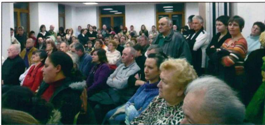
Ils étaient nombreux aux derniers vœux.