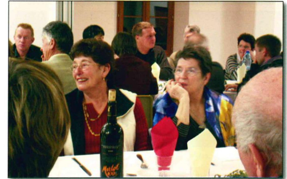
Ils sont nombreux à avoir œuvré pour la commune...