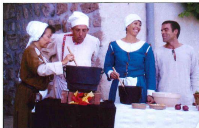
Pierre II au Château des Allinges (aux cuisines).