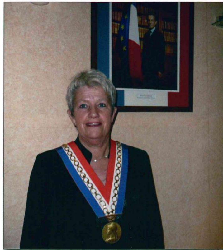
Dernière pause avant le départ.