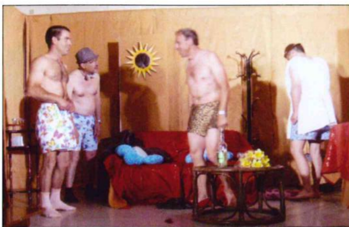
La bonne adresse.