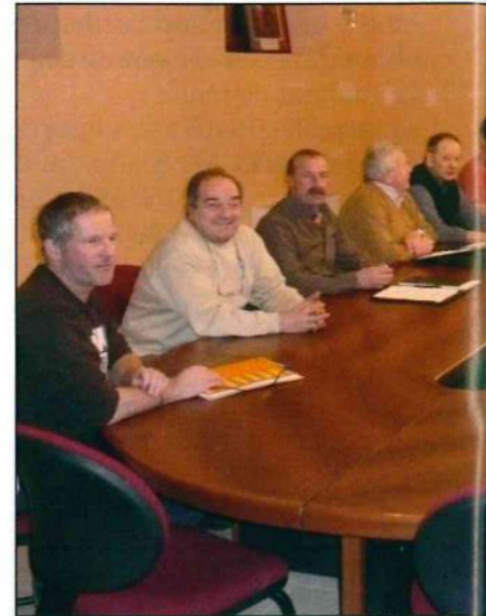
Dernier conseil, une bonne