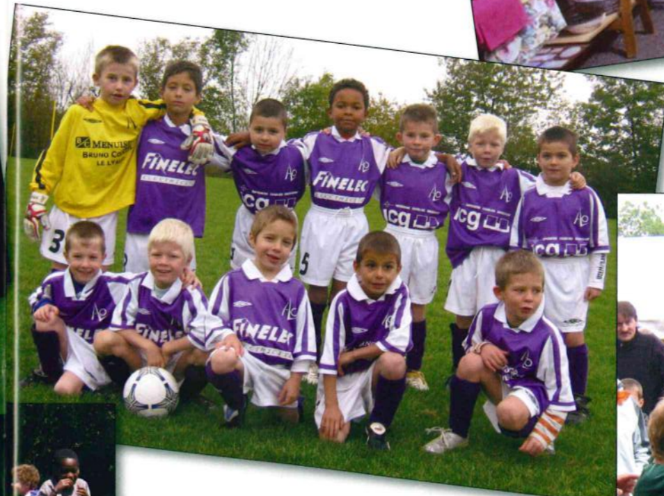
Le tournoi de Pentecôte