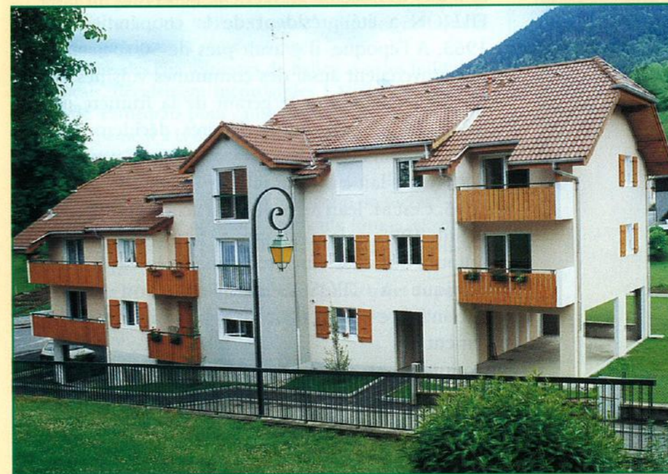
Le Clos de la Fruitière, façade côté rue de la Mairie