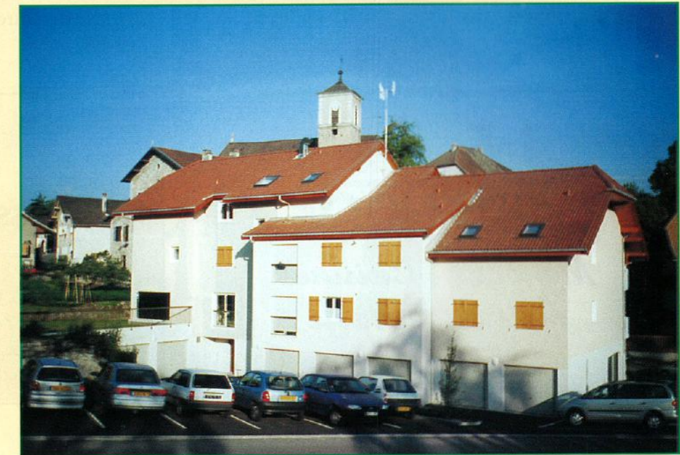
Le Clos de la Fruitière, façade côté rue de la Fruitière