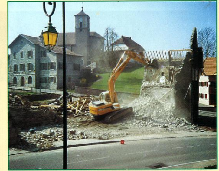
La Fruitière : la démolition (1999)