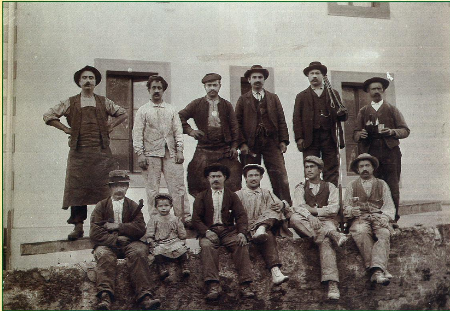
La Fruitière : la construction en 1908