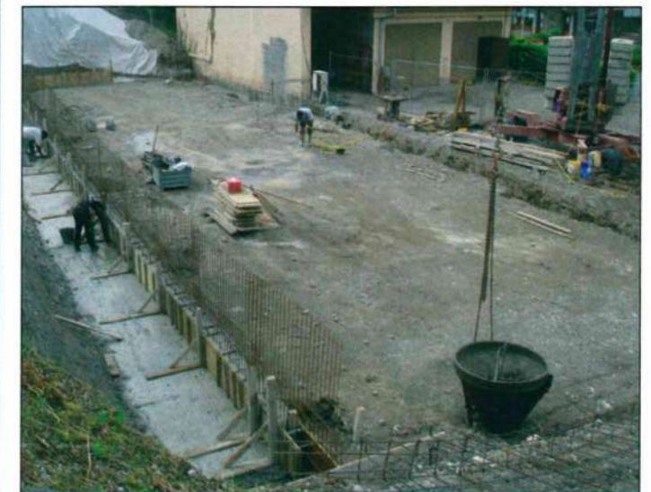
Début de la construction du hangar intercommunal