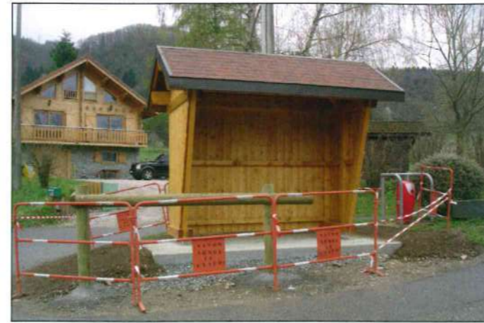
Création d'un abribus au hameau de Trossy