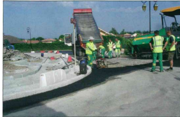
Route des Bois