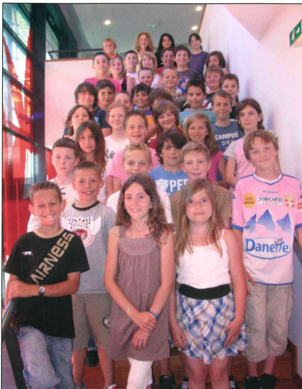
Bonne chance à tous !