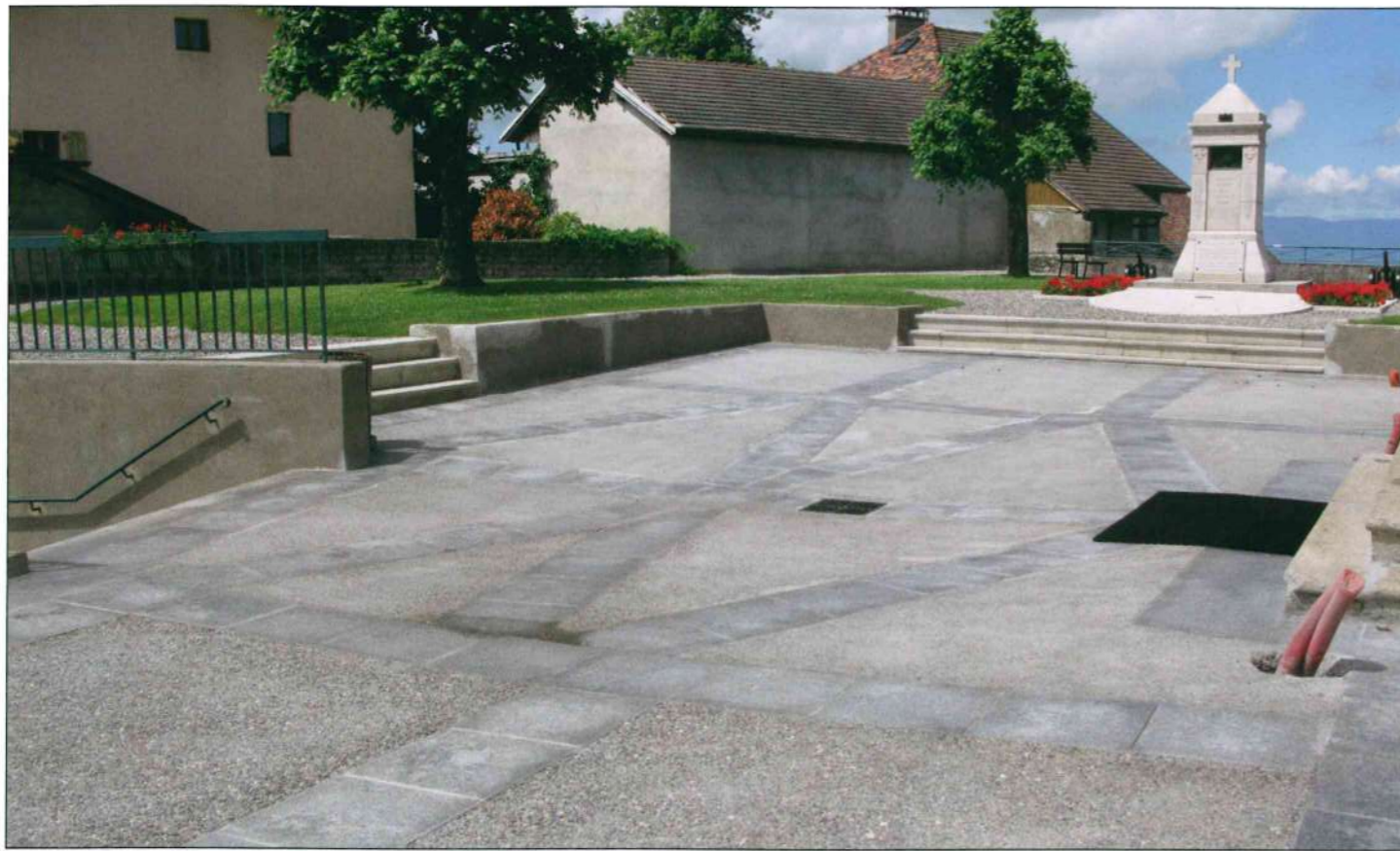
Parvis de l'église