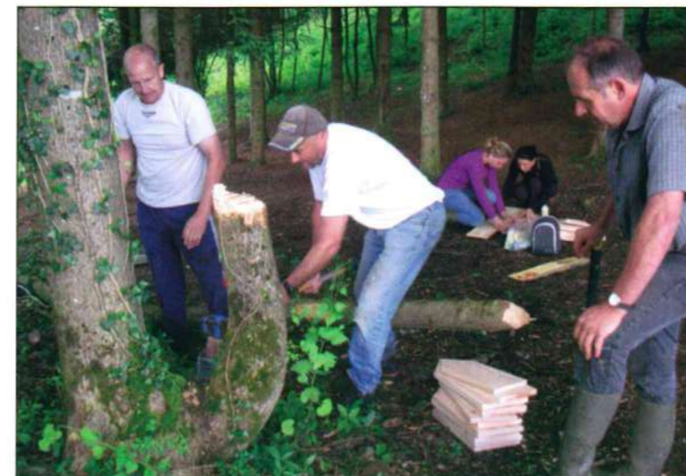
La commission en plein travail.