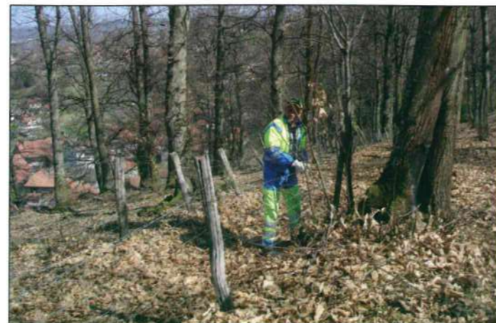
Colline du Cez