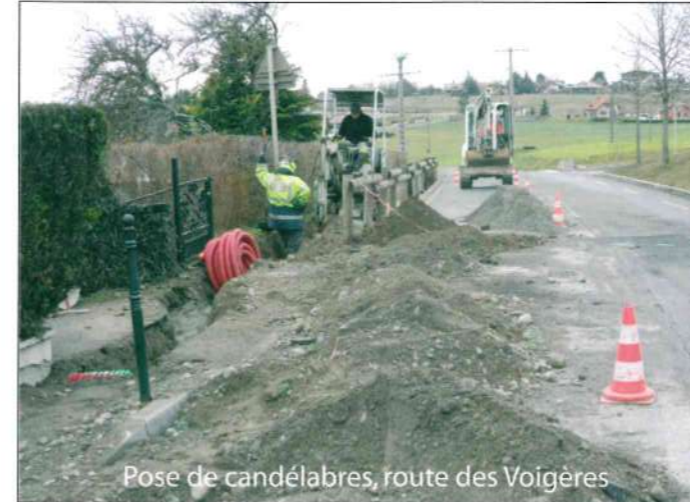
Pose de candélabres, route des Voigères