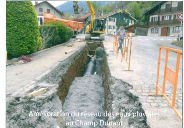
Amélioration du réseau des eaux pluviales au Champ Dunant