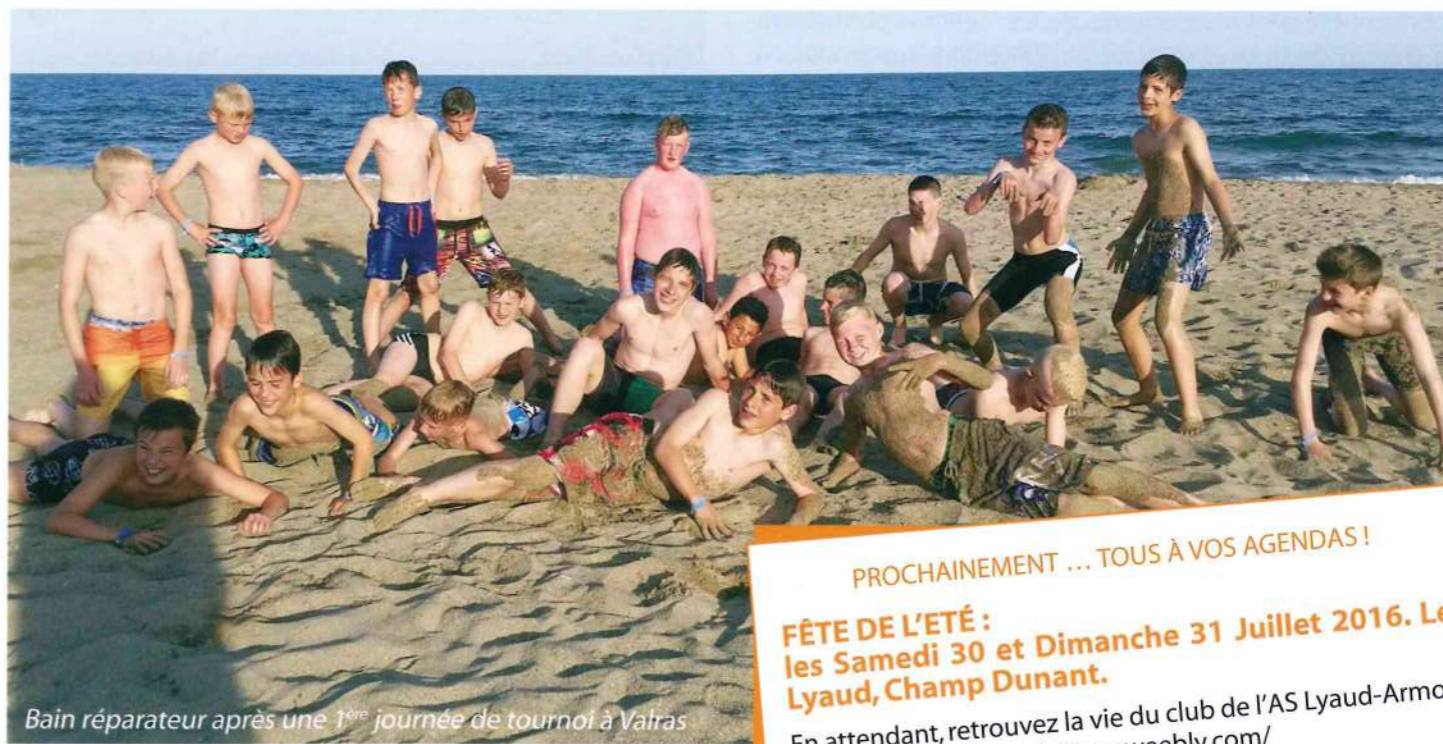
Bain réparateur après une 1 ère journée de tournoi à Valras