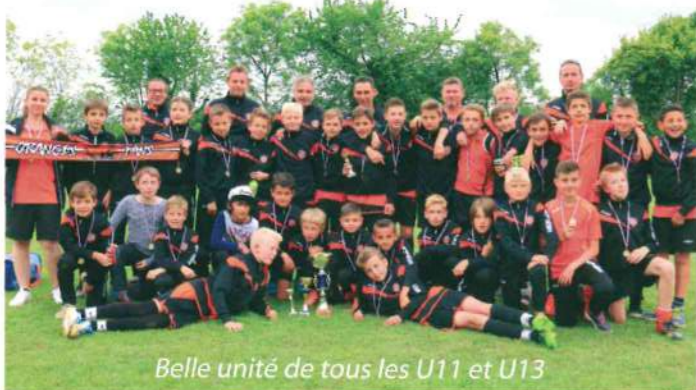
Belle unité de tous les U11 et U13

Pour sa 23 e édition, le Tournoi de football de Pentecôte de l'AS Lyaud-Armoy a de nouveau rencontré un franc succès. Cette manifestation sportive a rassemblé en 2 journées plus de 400 joueurs. 20 équipes U9 (8 et 9 ans) le samedi, avec en Finale une victoire d'Evian sur Ballaison, et le lundi, 24 équipes U11 (10/11 ans) et U13 (12/13 ans), où la Finale U11 voyait la victoire d'Allinges sur Margencel et en U13 la victoire de l'AS Lyaud-Armoy sur Vallée Verte.