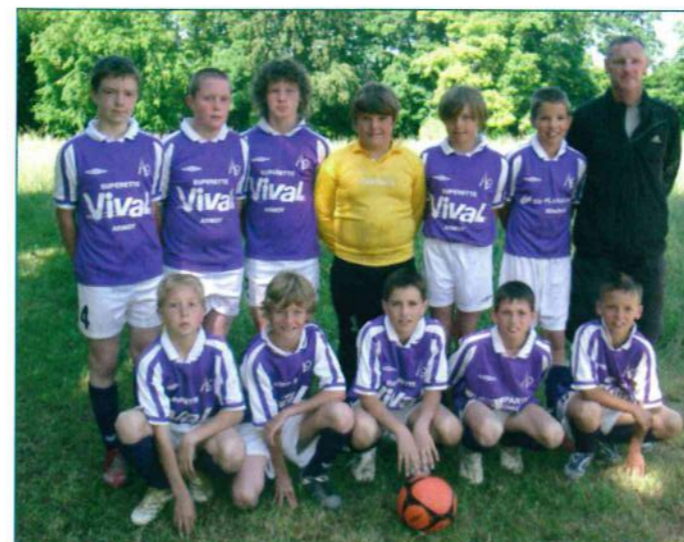
Les benjamins vainqueurs du tournoi de Sciez et du Lyaud