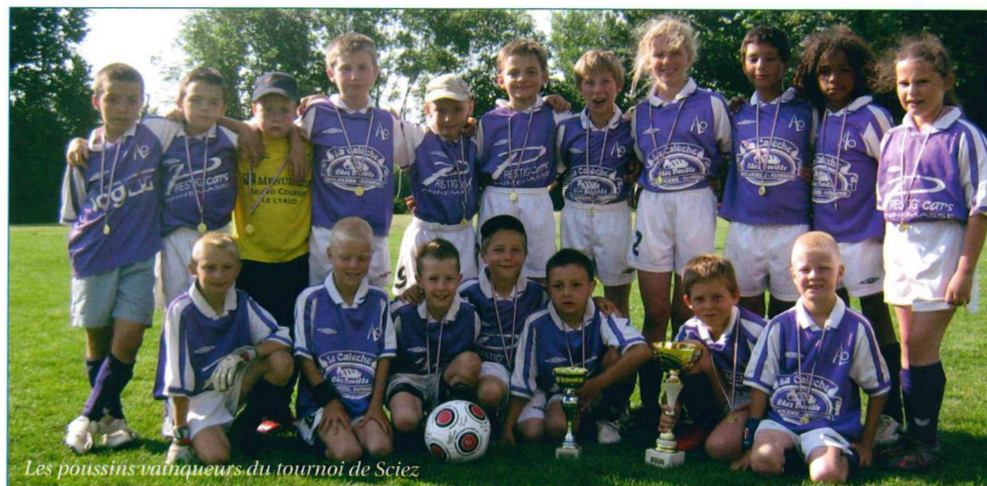
Les poussins vainqueurs du tournoi de Sciez

TRAVAUX PUBLICS GÉNIE CIVIL - TRANSPORTS DÉNEIGEMENT