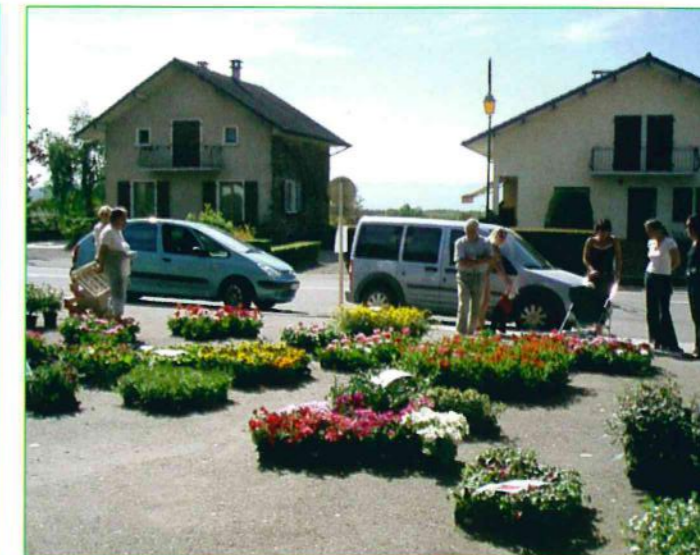
Vente de fleurs 2009

Rendez-vous à la rentrée pour l'élection du nouveau bureau. Toute nouvelle participation sera bienvenue !