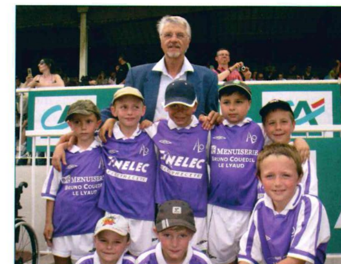
Les débutants : rencontre avec Aimé Jacquet au tournoi d'Aix-les-Bains