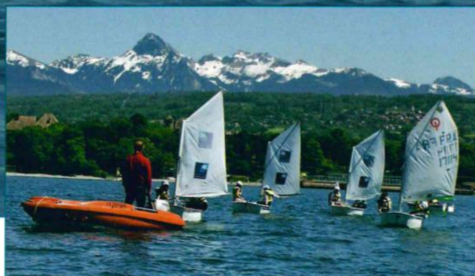
Les classes de CM2, sortie voile.